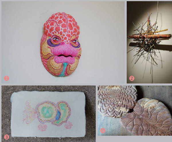
①金魚面_2021年 ②山の面_2017年 ③山のおしり_2023年 ④山に咲く_2018年

その循環の中に私たちの住む家が一粒一粒、抱かれている。家の中では沢山の生き物たちと交わる場面に立ち会います。山が産んだ水によって育まれたあらゆる生き物が食材となってやって来ます。様々な生き物が料理され食卓へ。家の中で山のかげらと身体とが混じり合い、いつも私たちが見ている生き物たちの行く末を、この場では様々な気配を纏う「何者か」に「見られている」という逆転させた場所へと開いていきたいと思っています。