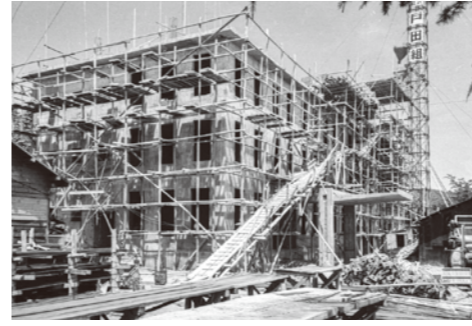
9. 長井市市庁舎 / 昭和 33 年 / 春に着工。8 月 23 日完成。足場は細木で組まれているようだ。