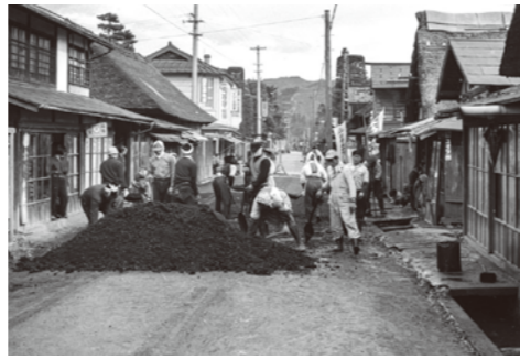
2. 風間書店の西 / 昭和 35 年 / 舗装工事。