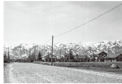
4. 東京電器 / 昭和 30 年代 / 昭和 16 年 9 月、工場誘致の地鎮祭に横綱双葉山を呼んだので、通称「双葉通り」という