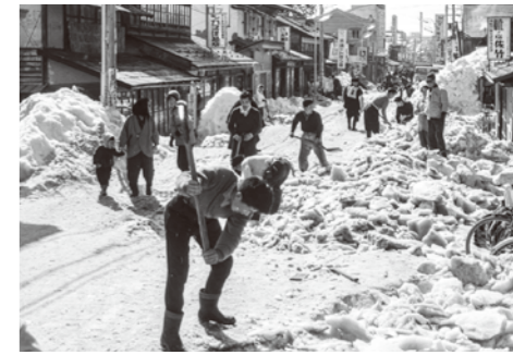
5. 大町通り / 昭和 36 年 3 月 6 日 / 雪割り除雪の作業風景。