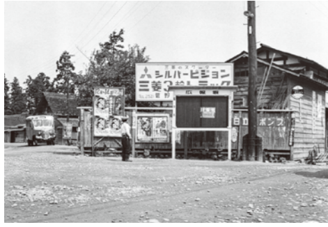
6. 館町南の三叉路 / 昭和 33 年頃 / 当時は多くの人がこの道を通った。