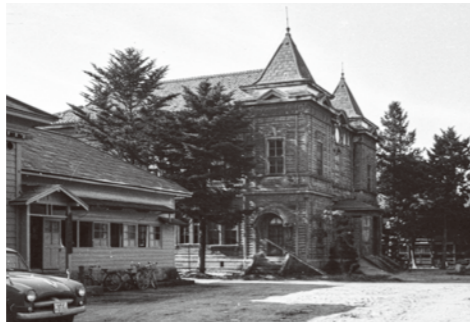
19. 旧郡会議事堂 / 昭和 35 年頃 / 小桜館の北にあった建物。市立図書館、置賜教育会図書館に使用されていた。昭和 43 年 7 月解体。