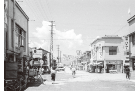
10. 中央十字路 / 昭和 33 年