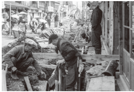
13. 高野町 / 昭和 30 年 / 側溝工事