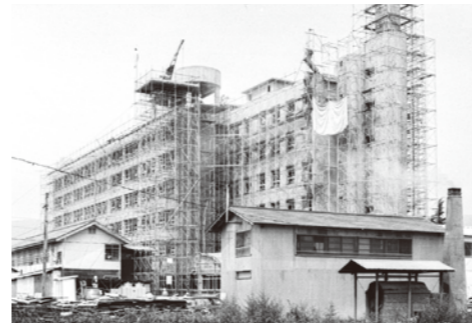
15. 市立病院建設 / 昭和 44 年