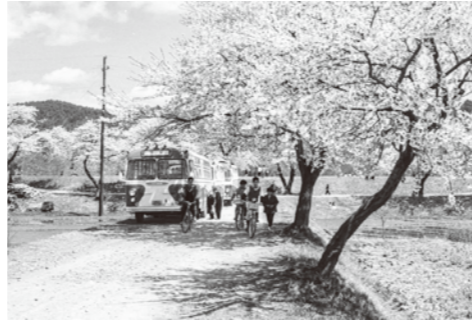
8. 最上川堤防 / 昭和 37 年頃