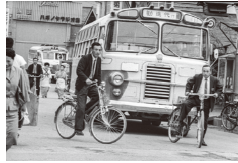
27. 中央十字路 / 昭和 35 年頃