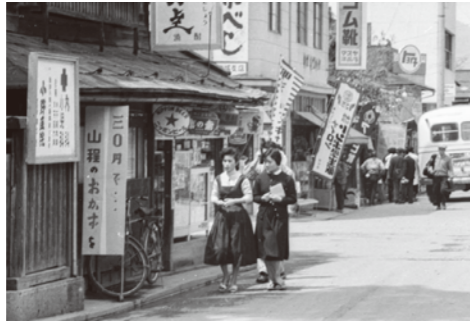
25. 中央十字路 / 昭和 33 年頃 / 30 円は当時の米価で換算すると約 120 円くらい。