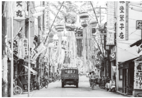
12. 本町での七夕まつり / 昭和 37 年