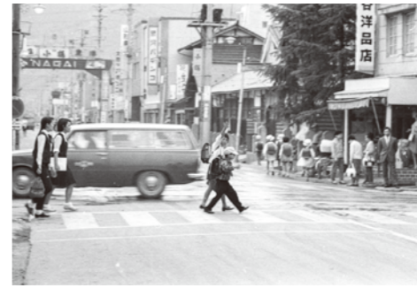
16. 駅前十字路 / 昭和 42 年