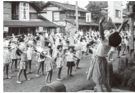
3. 大町税務署前 / 昭和 36 年 8 月 / 夏休み早朝のラジオ体操。現教育委員会庁舎。