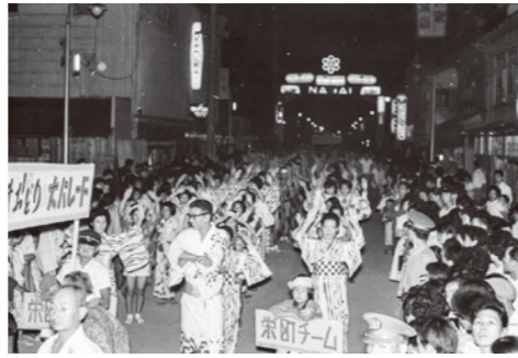
20. 長井おどり大パレード / 昭和 38 年 8 月 16 日 / 長井ブルースと長井盆唄発表記念。アーチ中央の紋章は、当時一時的に市章として扱われたもの。