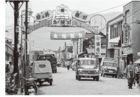
11. 駅前通り / 昭和 35 年 / 歓迎アーチには、近郷の酒の銘が書かれている。