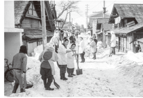
28. 十日町末広通り / 昭和 36 年 3 月 6 日 / 春になると地区民総出で雪割り除雪を行なった。