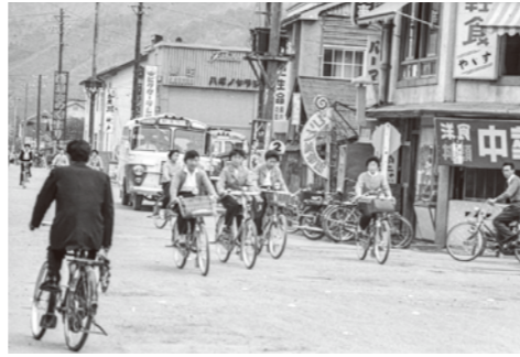
26. 中央十字路 / 昭和 35 年頃