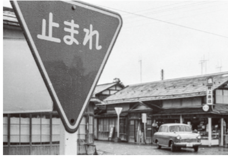
7. 田端の変形十字路 / 昭和 30 年代