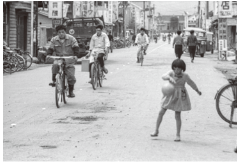
24. 駅前通り / 昭和 35 年