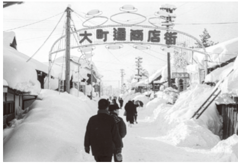
18. 大町通り / 昭和 36 年 / 当時、積もった雪は踏み固めるしかなかった。