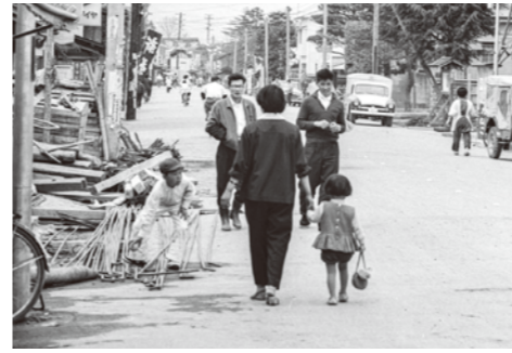
21. 栄町 / 昭和 31 年頃 / 現在のあやめ交番付近