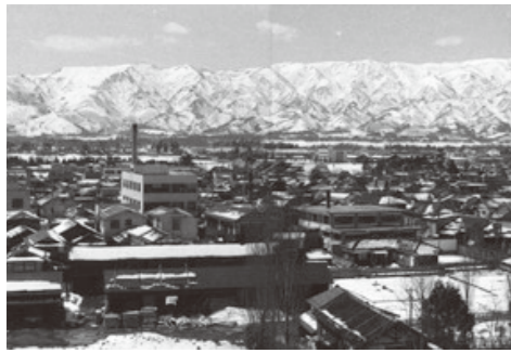
市役所屋上から西を望む / 昭和 40 年