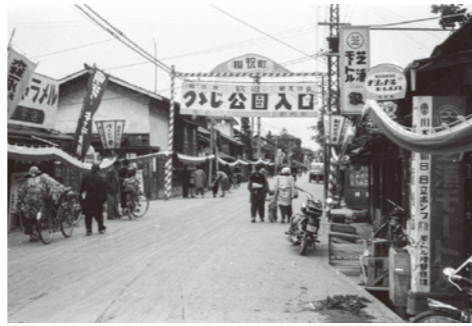
14. あら町薬師寺前 / 昭和 31 年 / やませ蔵手前の曲がり角を左折するとつじ公園がある。