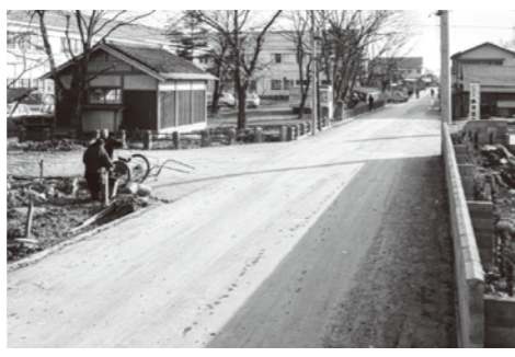
1. 市立病院西の通り / 昭和 42 年 1 月