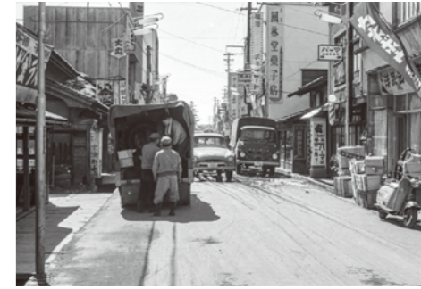
29. 本町通り / 昭和 30 年代