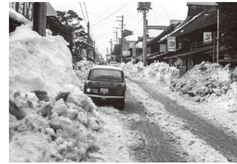
17. 十日町 / 昭和 44 年 / 雪害