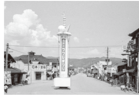
22. 駅前の歓迎塔 / 昭和 37 年