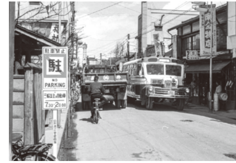
23. 本町通り / 昭和 36 年頃 / 4 月 1 日より駐車禁止となった本町通り。標識の英語表記は、戦後の進駐軍統治下の名残。